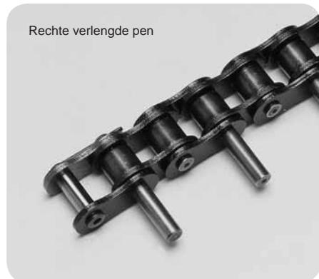
Rechte verlengde pen