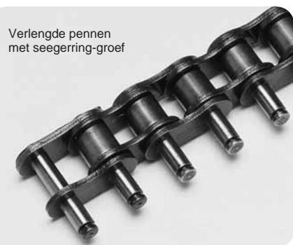
Verlengde pennen met seegerring-groef